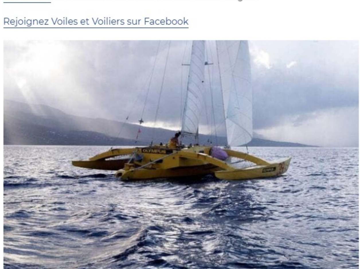
En soufflant de quelques secondes la victoire aux grands monoques dans la Route du Rhum 1978, Mike Birch sur son petit trimaran jaune Olympus annoncera aussi la suprématie des multicoques dans les grandes courses au large.

Rejoignez Voiles et Voiliers sur Facebook