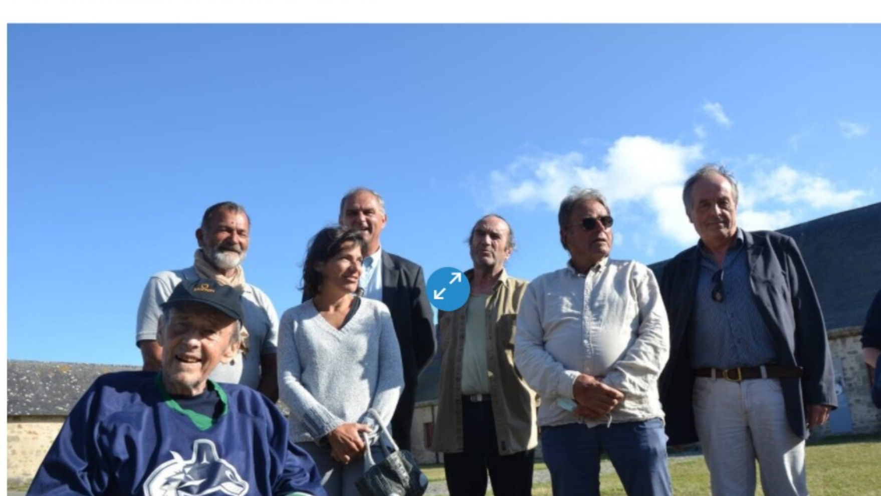
Insolite. Retrouvailles imprévues de sept cadors de la course au large